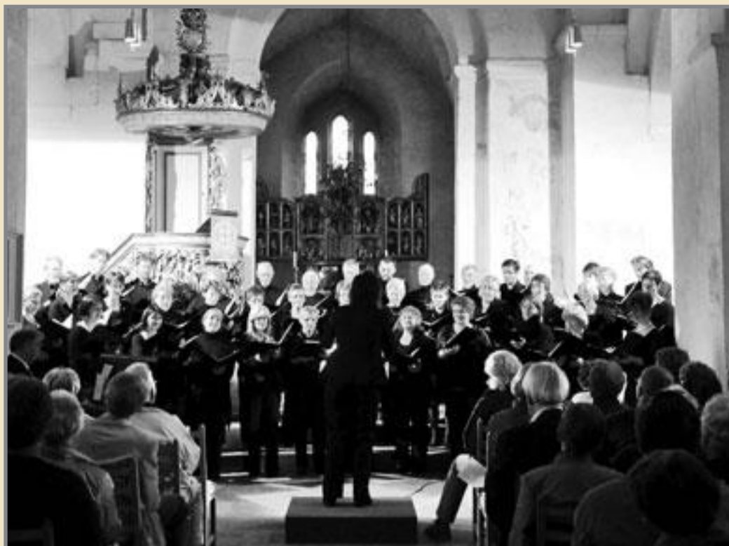
Det lyder mektig når Ringsaker Kantori og Tønsberg Domkor blander seg sammen i Ringsaker kirke.