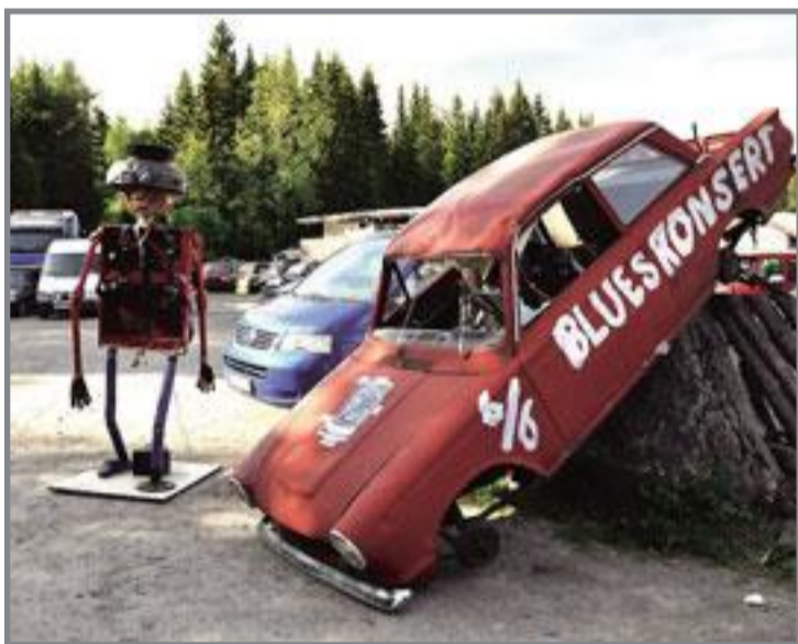
Slik hilser publikum velkommen til en høggerikonserert.