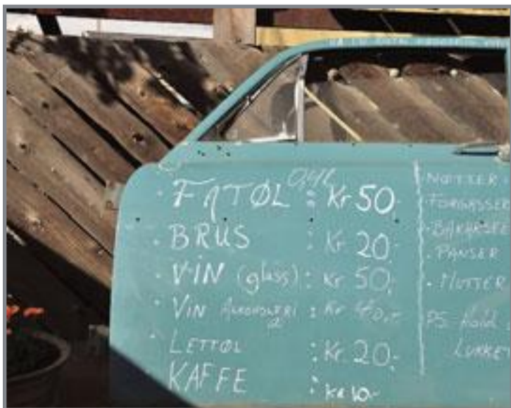
Og slik presenteres menyen.